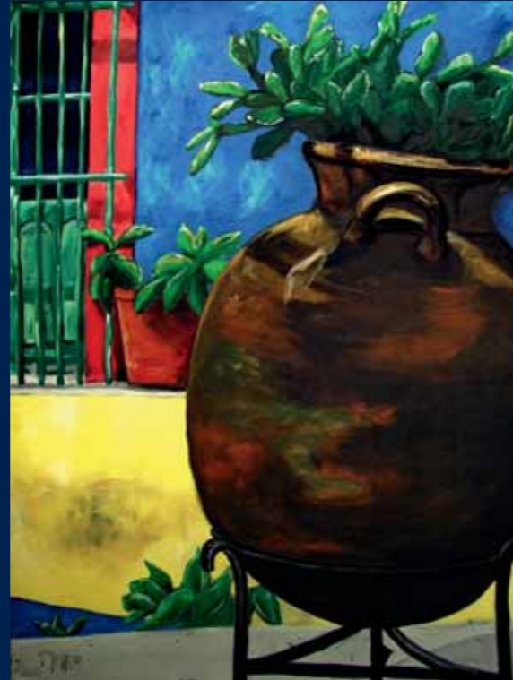
In Fridas Garten