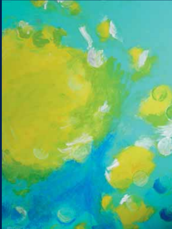
Geburt eines Traums | © Herbst 2010